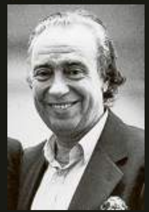
Una foto degli anni '90

Un progetto della Regione Liguria per salvare quaranta ore di registrazioni che rischiavano di andare perdute