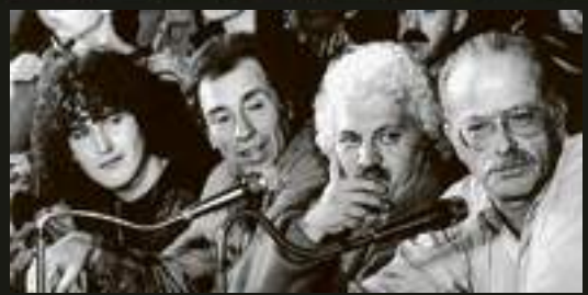
Con Bruno Lauzi e Gino Paoli